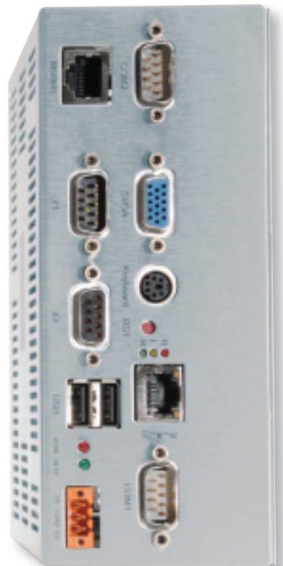
Die Retrofit-Serie von Syslogic beinhaltet sowohl Boards als auch Box-PCs.